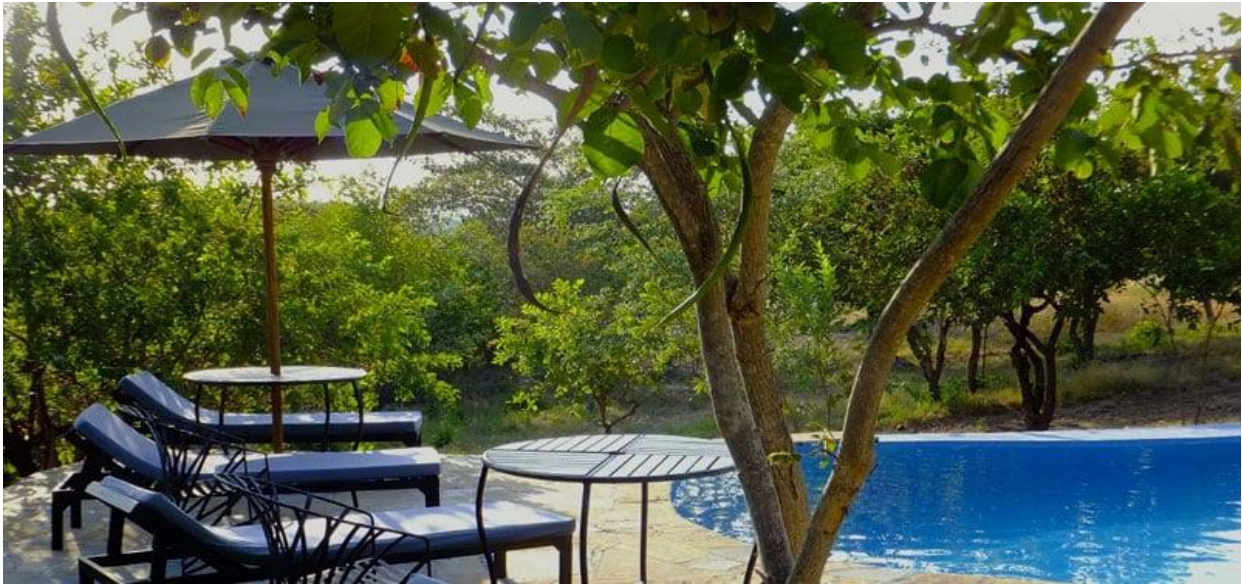
Cocktail de bienvenue à base de jus de fruit sans alcool Installation dans vos chambres, dîner et logement